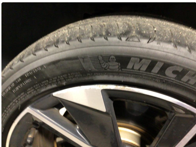
1.1 Litt kant kjørt felg høyre side foran. Sommerdekk felg