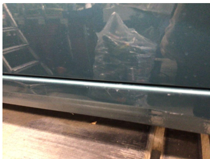
1.4 Små riper på kanal venstre side.