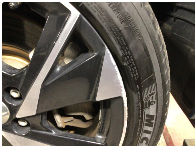
1.1 Litt kant kjørt felg høyre side foran. Sommerdekk felg