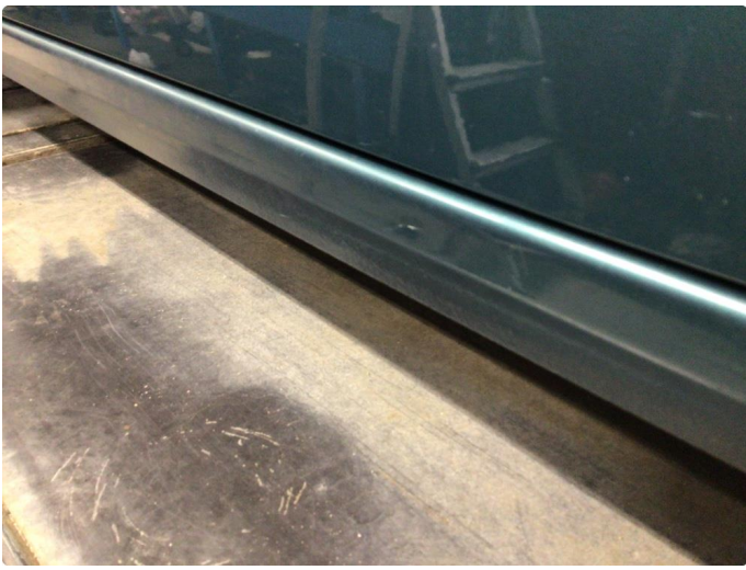
1.4 Små riper på kanal venstre side.