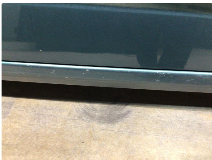
1.3 Noen små riper i lakken på høyre kanal.